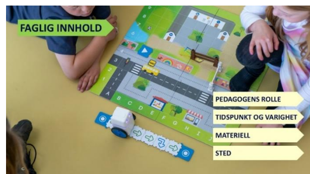
Bilde 8: To barn som leker med en KUBO-robot.

I et slikt lekemiljø kan jeg legge til rette for Lokalisering ved å sette inn utfordringer som gir barna behov for å beskrive ruten og forklare posisjonene til KUBO og hindringene. Bokstaver og tall på gulvmatten viser til et innebygd koordinatsystem. Pedagogens rolle er å legge til rette for oppdagelsen av dette.