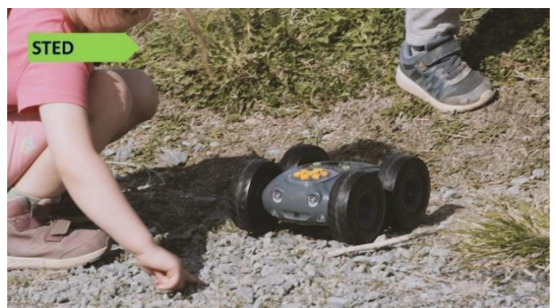
Bilde 5: Rugged-robot.