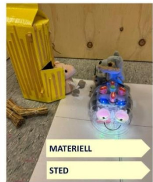
Bilde 6: «Digitalt rom» med en trekasse skreddersydd for spontan og planlagt lek.