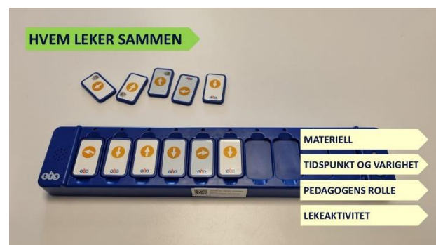
Bilde 7: Storyboard.

Hvis barna er godt kjent med teknologi, kan de få større frihet i valg av oppgaver, lage spill, og utforske på egen hånd.