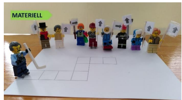
Bilde 4: "Unplugged" programmering med Lego-figurer.